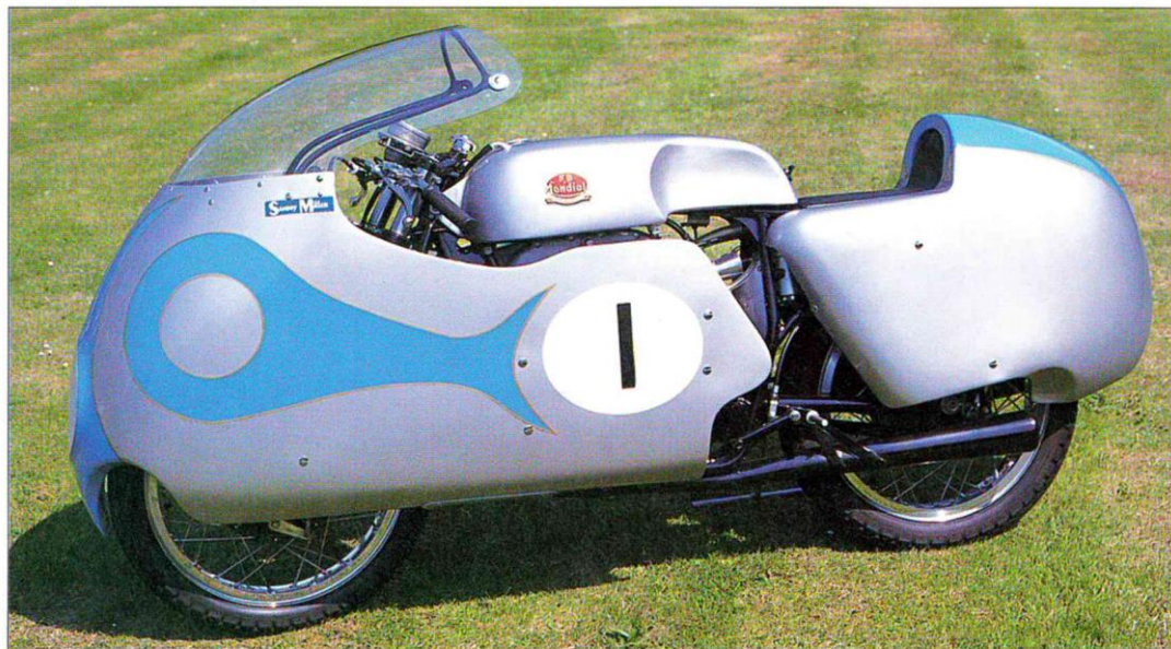
Motocykl wyścigowy FB Mondial GP z lat 50. Większość maszyn sportowych z tego okresu wyposażano w takie opływowe obudowy, aby poprawić aerodynamikę. Na tym motocyklu z silnikiem 250 cm 3 wygrywał wyścigi Cecil Sandford.